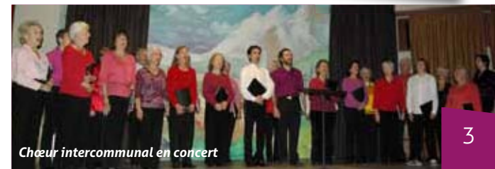
Cheur intercommunal en concert