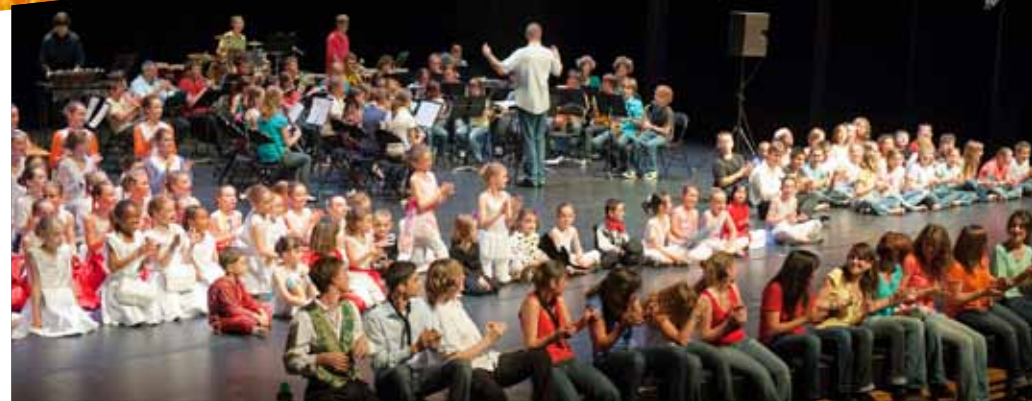
Avant-concert au DÔME Théâtre dans le cadre d'un projet départemental